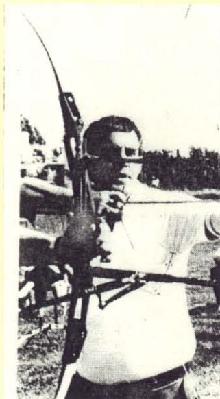
Sur les traces de Robin des Bois